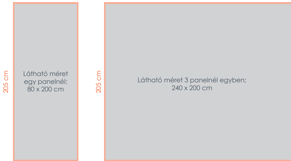
Kifutós méret: 244 cm

A 3 db-ból álló szerkezet összekapcsolva egyben és külön is használható, egyenes és íves összeállításban is.